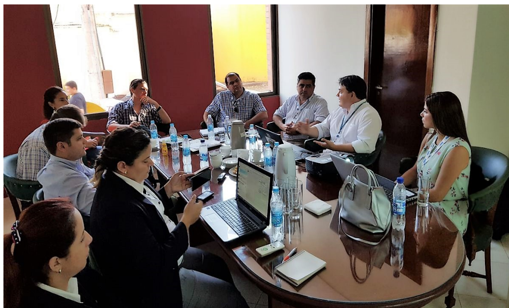
Sala de reuniones de la ARP, espacio de presentación de objetivos trazados para este nuevo año.

Representantes de los proyectos: Paisajes de Producción Verde y Green Commodities Chaco, ambos liderados por la Secretaría del Ambiente (SEAM) y coordinados por el Programa de las Naciones Unidas para el Desarrollo (PNUD), realizaron una breve presentación de los objetivos trazados y estrategias delineadas para la implementación de acciones para el 2018, que logren la conservación de la biodiversidad.