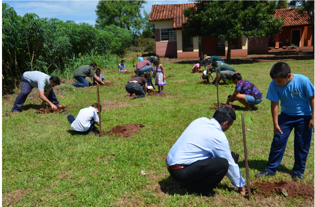
El acuerdo con ATP tiene como fin sensibilizar y promover, a nivel de comunidades y familias de productores.

Para este acuerdo, el PPPV a través del financiamiento del Fondo Mundial Para el Medio Ambiente (FMAM), destina el monto de G. 834.500.000 (Ochocientos treinta y cuatro millones quinientos mil Guaraníes) a fin de sensibilizar y promover, a nivel de comunidades y familias de productores, la integración de la biodiversidad y el manejo sustentable de la tierra, así como la restauración de bosques protectores de cauces hídricos y reservas legales, buscando incrementar la conectividad en áreas altamente fragmentadas.