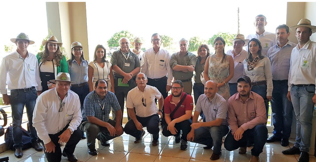
Participantes de la Reunión Plenaria de la Plataforma Departamental de Soja Sustentable de Alto Paraná representando a diversos sectores (público, privado, académico y de investigación, sociedad civil).

BOLETÍN N° 24 AÑO 3 - ABRIL 2018 - NOTICIAS