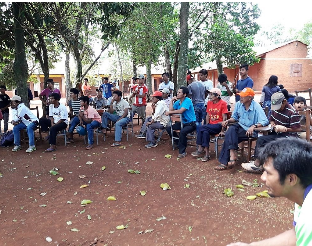
Líderes de comunidades indígenas de la zona, son capacitados a través del proyecto liderado por la SEAM.

BOLETÍN N° 24 AÑO 3 - ABRIL 2018 - NOTICIAS