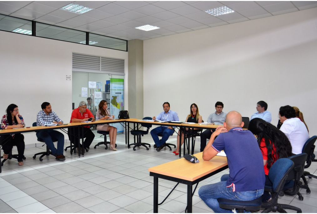
Técnicos especialistas de la Secretaría del Ambiente (SEAM), del Instituto Forestal Nacional (INFONA), y del Proyecto Paisajes de Producción Verde (PPPV) reunidos para delinear acciones a implementar.

BOLETÍN N° 24 AÑO 3 - ABRIL 2018 - NOTICIAS