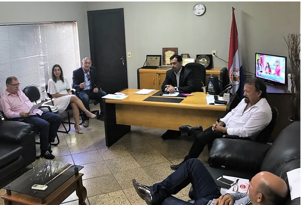
Miembros del Comité Directivo de la Plataforma Departamental de Soja Sustentable de Alto Paraná.